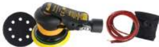
Kuruma Sander 5" 5150SV Velcro 8H Vacuum หลักรุ่น