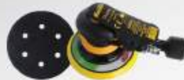
Kuruma Sander 6" 6150CV Velcro 6H Vacuum หลักรุ่น