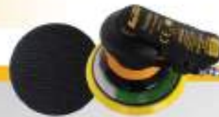
Kuruma Sander 6" 6150N Velcro หลักรุ่น