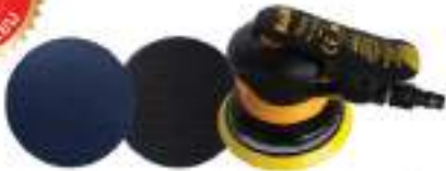
Kuruma Sander 5" 5150N Velcro หลักรุ่น / PSA หลักรุ่น