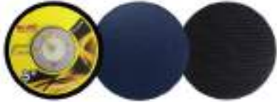
Pad dia 5" PSA หลักราว / Velcro หลักรอบ