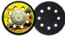
Pad dia 5" Velcro หลักรอบ 8H