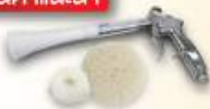
Kuruma Air Pulser Blow Gun FB-10-V2T ปืนพ่นลม