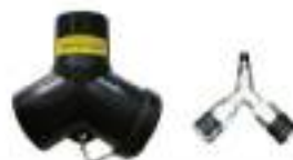
Dual Sander Adapter Set