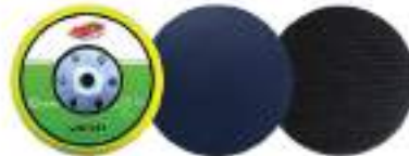
Pad dia 5" PSA หลักราว / Velcro หลักรอบ