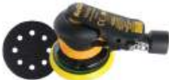
Kuruma Sander 5" 5150CV Velcro 8H Vacuum หลักรุ่น