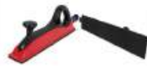
Sanding Block 70x420 mm. (14Hole)

บล็อกขัดทรงจานทราย ขนาด 70 x 125 มม. (8รู)