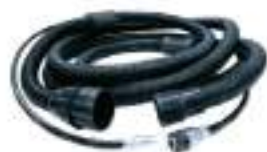
Suction Hose and Air Hose Length 5M.

บล็อกขัดทรงจานทราย ขนาด 70 x 198 มม. (11รู)