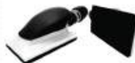
Sanding Block 70x125 mm. (8Hole)

บล็อกขัดทรงจานทราย ขนาด 70 x 125 มม. (8รู)