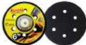
Pad dia 6" Velcro หลักรอบ 6H

Kuruma Sanding Pad 5", 6" เป็นรองขัดกระดาษทรายกลม