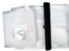
Filter Bag 34L.