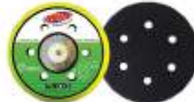
Pad dia 6" Velcro หลักรอบ 6H

MEGA Sanding Pad 5", 6" เป็นรองขัดกระดาษทรายกลม