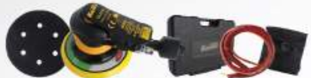
Kuruma Sander 6" 6150SVK Velcro 6H Vacuum หลักรุ่น