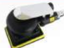
Kuruma Sander 3"x 4" 3040N Velcro หลักรุ่น