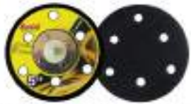
Pad dia 5" Velcro หลักรอบ 6H