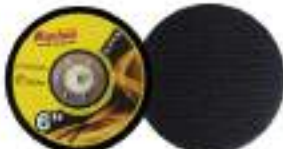
Pad dia 6" Velcro หลักรอบ