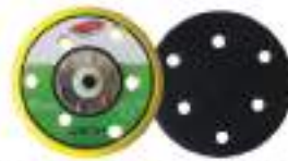
Pad dia 5" Velcro หลักรอบ 6H